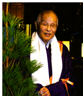
内海住職よりご法話