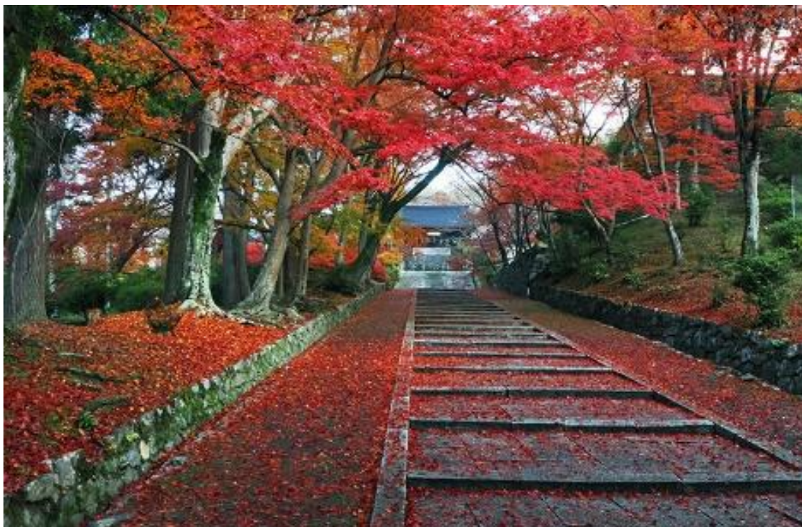
紅葉 毘沙門堂 京都山科 2025.12.26

教林坊に行く途中、朝1番に寄りました。ここは桜やモミジの季節に何度か来ていますが何十年ぶり。少し早い目かと思いましたが、昨夜雨が降ったので散り紅葉を期待して来ました。散り紅葉はやはり少な目でしたが、何とか晩秋の風情のある光景が撮れました。ここは以前はお寺の駐車場が使えましたが今は使用禁止で付近に駐車場は無いので車は注意です。定番的な場所とは言っても条件が揃った日に現場に立つのは容易ではありません。