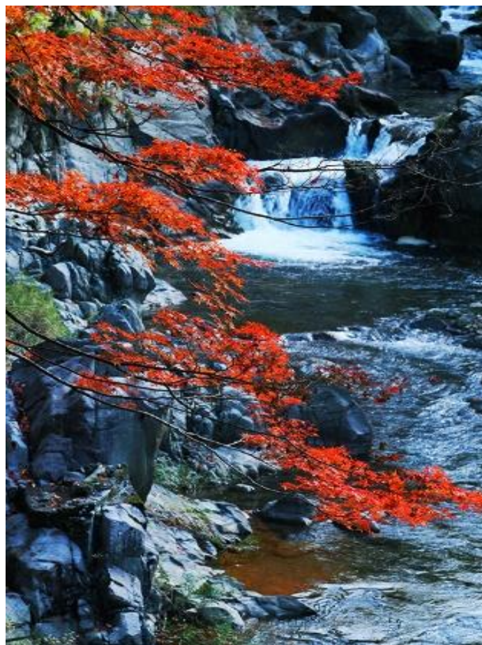
一度来てみたかった場所。西明寺の近く。