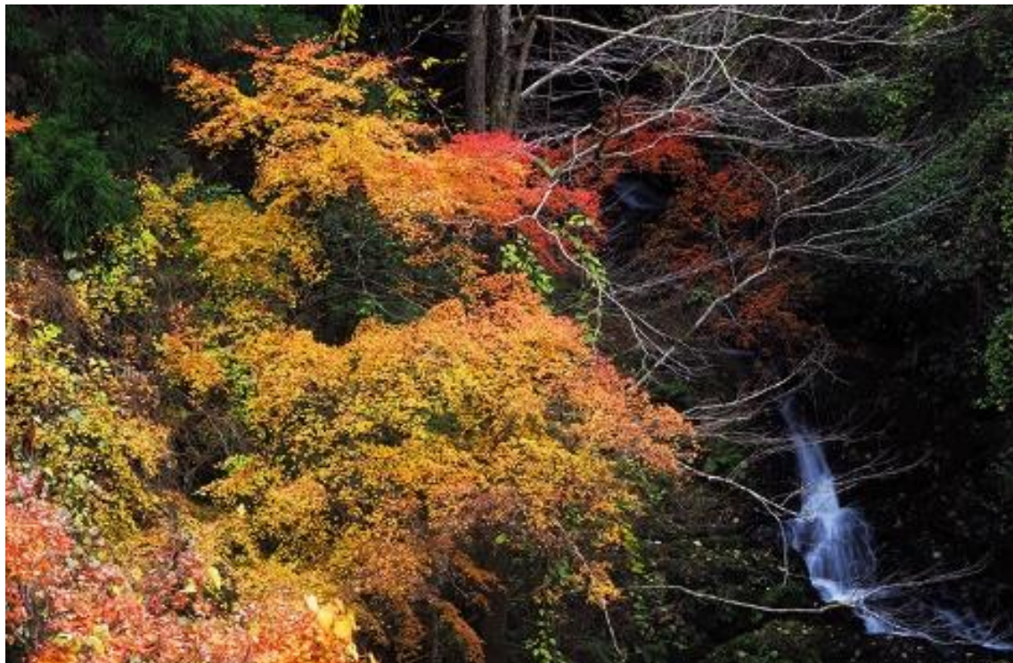
橋本富貴への途中に出会った溪流の紅葉