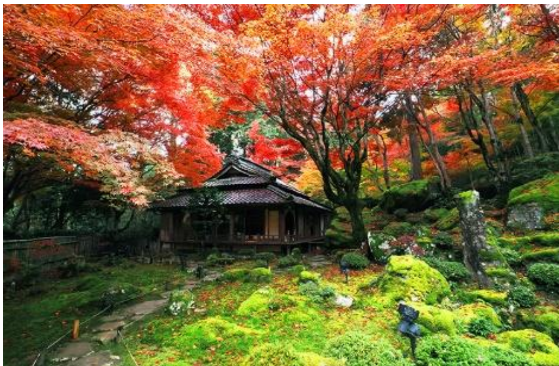
紅葉 教林坊 滋賀県近江八幡市安土 2025.12.26

教林坊に行く途中、朝1番に寄りました。ここは桜やモミジの季節に何度か来ていますが何十年ぶり。少し早い目かと思いましたが、昨夜雨が降ったので散り紅葉を期待して来ました。散り紅葉はやはり少な目でしたが、何とか晩秋の風情のある光景が撮れました。ここは以前はお寺の駐車場が使えましたが今は使用禁止で付近に駐車場は無いので車は注意です。定番的な場所とは言っても条件が揃った日に現場に立つのは容易ではありません。