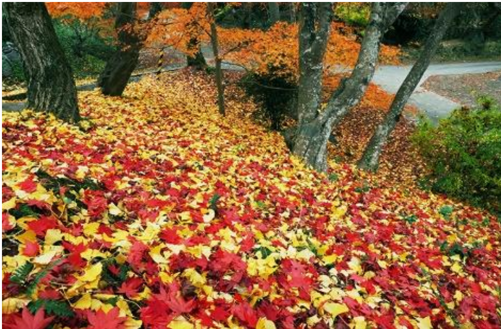
銀杏と紅葉の落葉がきれいでした。