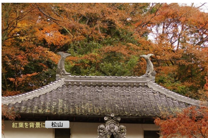
紅葉を背景に 松山