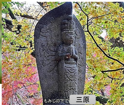
もみじの下で 三原