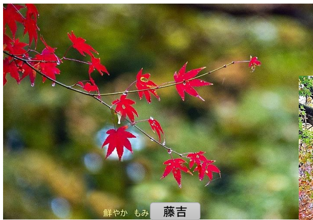
鮮やか もみ 藤吉