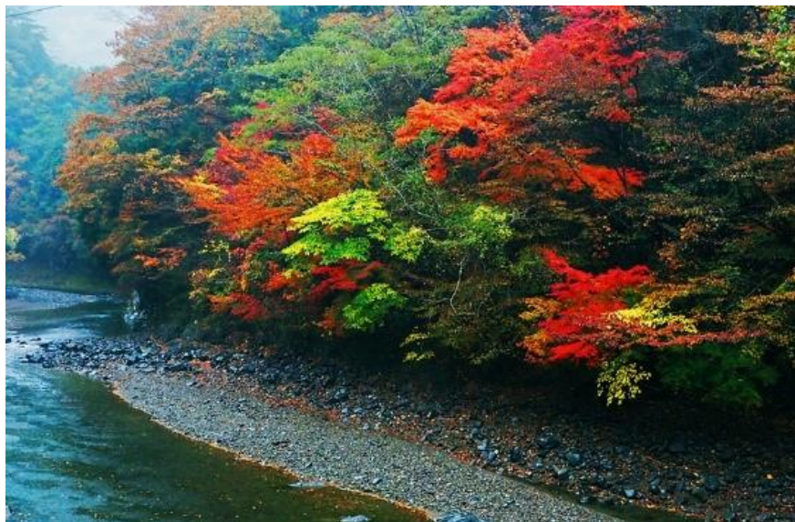
奥高野野迫川村大股

この場所での紅葉時期は雨が少なくタイミングも遅ればせながらの撮影行でしたが、この辺りだけが色づきのいいところが残っていて何とか何枚か撮れました。この日は雨上がりに合わせて午後の出発になったので途中で時間切れになり十分には撮れませんでした。