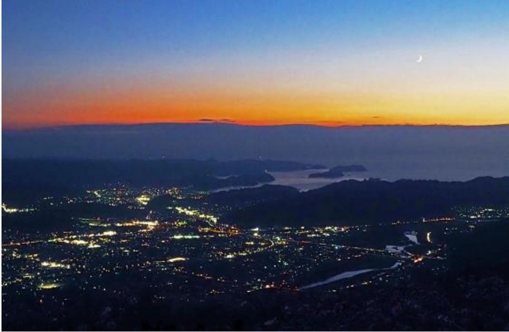
鷲ヶ峰からの夜景・有田市