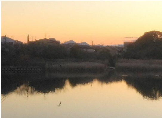
日の出前の二上山