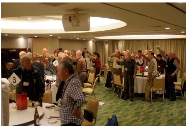
ビンゴに期待の会場