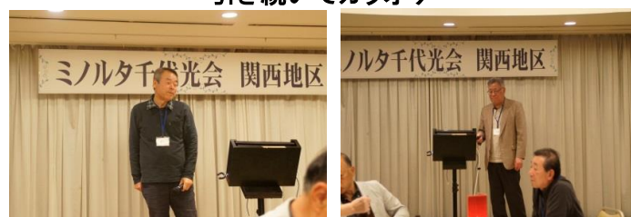
引き続いてカラオケ