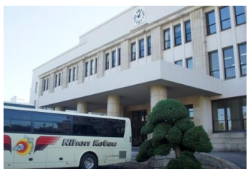
(硬貨・勲章を製造)