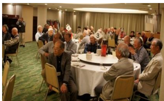
待望！ 慣例のビンゴ開始