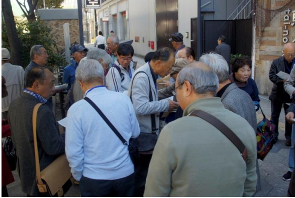
* 難波(南都銀行前)集合