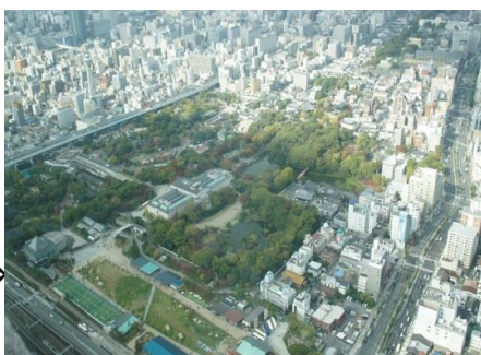
(天王寺公園・美術館・動物園・茶臼山)