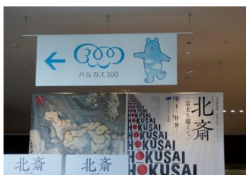
北斎展コース 展望台コース (あべのハルカスで2コースに別れました)