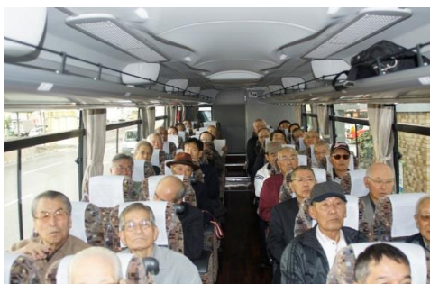
バスに乗り込み出発

11月9日(木)に実施の関西地区秋の日帰り旅行の写真速報版です。 行程は、大阪歴史博物館見学⇒あべのハルカス(展望台コース・北斎展鑑賞コース)⇒懇親会の予定でしたが、北斎展が盛況で急遽、あべのハルカスを先に訪れる行程に変更となりました。